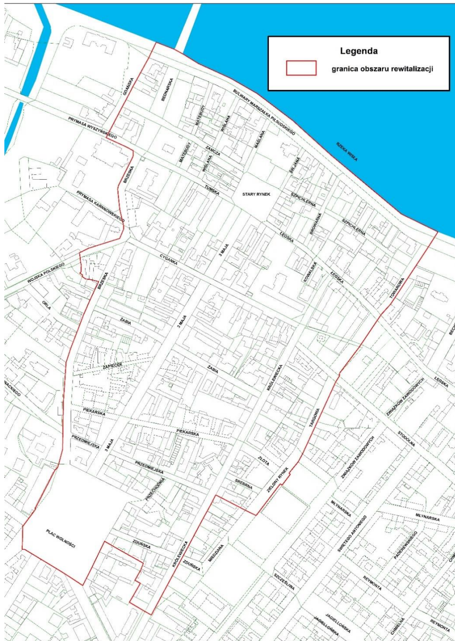
Rycina. 1. Granice obszaru rewitalizacji