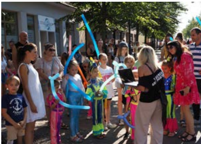
Kolorowe balony, gry i zabawy dla dzieci muszą być zawsze!