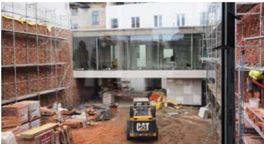
Widok na dziedziniec przyszłego Centrum Aktywizacji i Przedsiębiorczości przy ul. 3 Maja 18.

Budowa Centrum Aktywizacji i Przedsiębiorczości jest jednym z flagowych projektów Gminnego Programu Rewitalizacji Miasta Włocławek na lata 2018-2028. W nowoczesnej przestrzeni będą mieścić się m.in. bank pracy, punkt doradztwa prawno-zawodowego, siedziba Stowarzyszenia WŁOF oraz miejsce, w którym wspieramy rozwój ekonomii społecznej. W kamienicy przy ul. 3 Maja 18 znajdują się też mieszkania dla uzdolnionych absolwentów szkół technicznych, mieszkanie-studio rezydenta pracującego z lokalną społecznością oraz podwórko partycypacyjne.