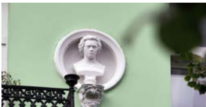
Wystarczy spojrzeć w górę, na elewację kamienicy, a naszym oczom ukazuje się popiersie wybitnego kompozytora Ludwiga van Beethovena.

Prace realizowane są dzięki dotacji udzielonej w ramach Gminnego Programu Rewitalizacji Miasta Włocławek na lata 2018-2028. Warto dodać, że już wkrótce kamienica będzie przyłączona do sieci ciepłowniczej – to efekt prac Miejskiego Przedsiębiorstwa Energetyki Ciepłej we Włocławku. Dzięki inwestycji, zarządzające budynkiem Lokalne Zrzeszenie Właścicieli Nieruchomości zlikwiduje 24 piece „kopciuchy”.