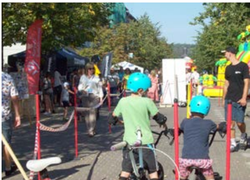
Mali miłośnicy sportów rowerowych pilnie ćwiczyli na wytyczonym torze.