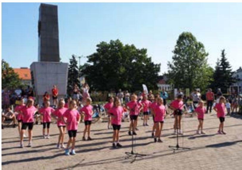
Dziecięcy tancerze sprawili, że wszyscy odczuli przyływ energii.