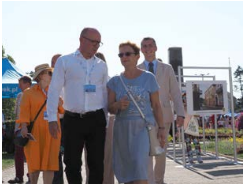
Piknik Rewitalizacyjny był doskonałą okazją do spotkań i rozmów.