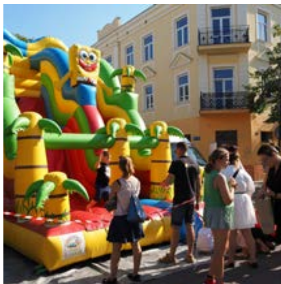
Kolorowe, dmuchane zjeżdżalnie jak zwykle były oblegane przez najmłodszych.