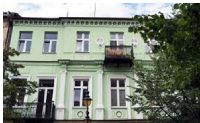
Front kamienicy przy ul. 3 Maja 10/12.

To z elewacji tej kamienicy „spogląda” na nas popiersie słynnego kompozytora, Ludwiga van Beethovena. Rzeźba umieszczona jest po prawej stronie fasady. Po lewej stronie widoczna jest natomiast rzeźba, która przedstawiała zapewne Josepha Haydna lub Wolfganga