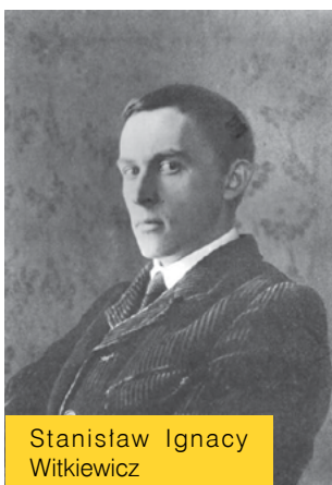
Stanisław Ignacy Witkiewicz