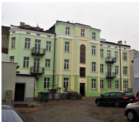
ul. 3 maja 30