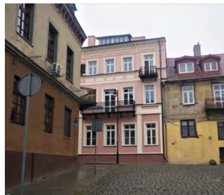
ul. Łęgska 79