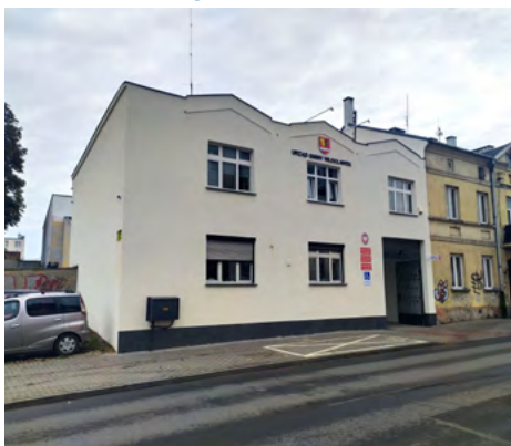
ul. Królewiecka 7