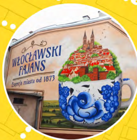
WOJSKA POLSKIEGO 3

#SZLAKIEMŚRÓDMIEJSKICHMURALI #REWITALIZACJA #WŁOCŁAWEK